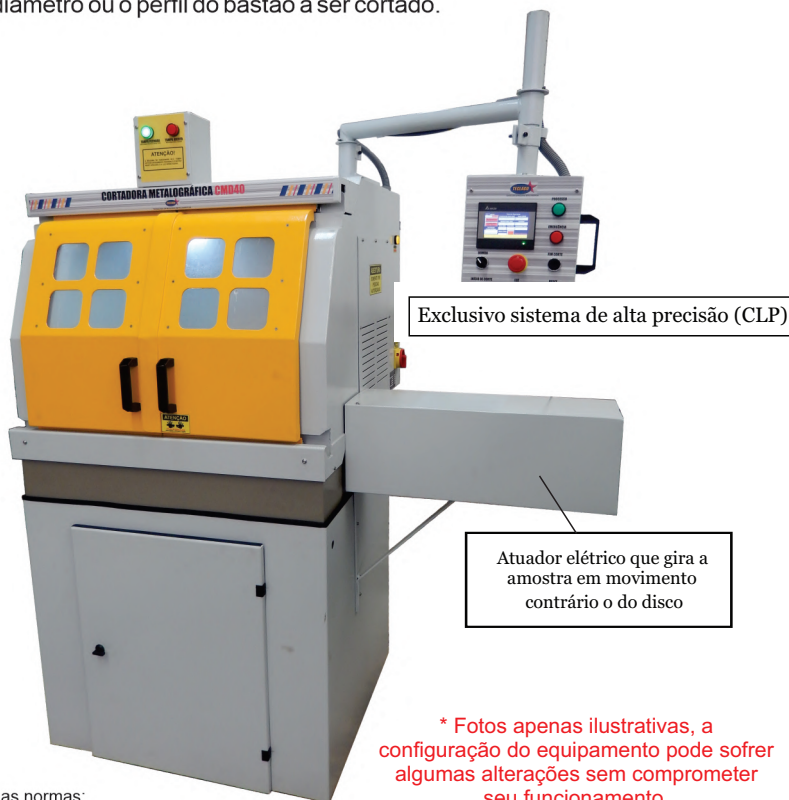
Exclusivo sistema de alta precisão (CLP)