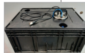
Sistema de refrigeração (opcional)