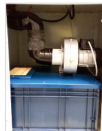
Sistema de exaustão com bancada (opcional)