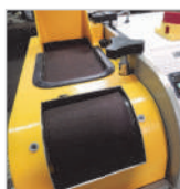
Abertura da lixa: 100mm x 20mm Abertura frontal de 100mm x 200mm (opcional)