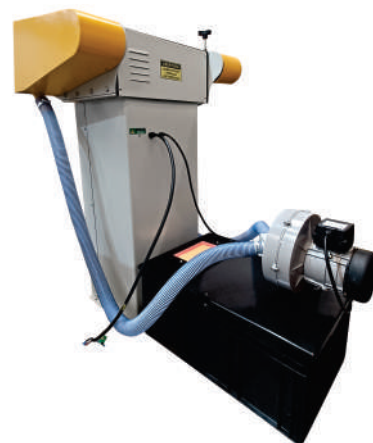
Opcionalmente poderá ser fornecido com exaustor tipo siroco para as duas cintas. Este exaustor será acionado junto

*Fotos apenas ilustrativas, a configuração do equipamento pode sofrer algumas alterações sem comprometer seu funcionamento.