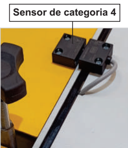
Sensor de categoria 4