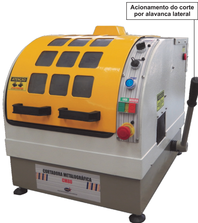
Acionamento do corte por alavanca lateral