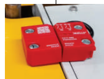
Sensor de categoria 4

*Fotos apenas ilustrativas, a configuração do equipamento pode sofrer algumas alterações sem comprometer seu funcionamento.