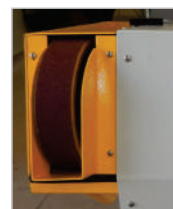
Área útil de lixamento de 1200mm x 50mm