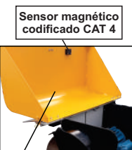
Sensor magnético codificado CAT 4