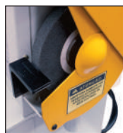
Guarnições de proteção do rebolo

SISTEMA DE FREIO ELETROMAGNÉTICO DOS REBOLOS COM PARADA AUTOMÁTICA ATÉ 6 SEGUNDOS APÓS O DESLIGAMENTO , atendendo assim às exigências da NR-12.