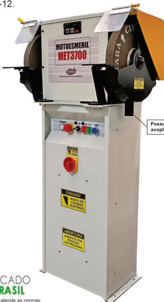
Possui duto para acoplar exaustor