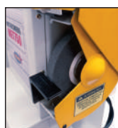
Guarnições de proteção do rebolo

SISTEMA DE FREIO ELETROMAGNÉTICO DOS REBOLOS COM PARADA AUTOMÁTICA ATÉ 6 SEGUNDOS APÓS O DESLIGAMENTO , atendendo assim às exigências da NR-12.