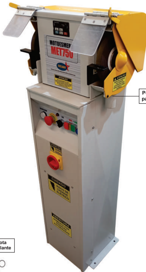
Possui dutos para exaustão