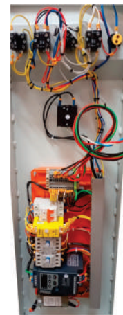
Elétrica adequada a NR-10 e NR-12