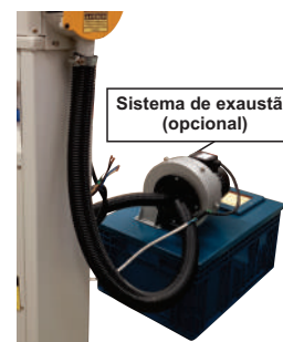
Sistema de exaustão (opcional)

*Fotos apenas ilustrativas, a configuração do equipamento pode sofrer algumas alterações sem comprometer seu funcionamento.