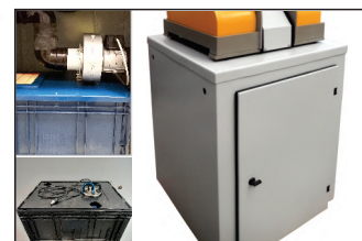
Sistema de exaustão ou refrigeração com bancada (opcional)