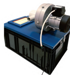
Sistema de exaustão (opcional)