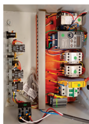
Painel elétrico adequado a NR-10 e NR-12

SISTEMA DE FREIO ELETROMAGNÉTICO DOS REBOLOS COM PARADA AUTOMÁTICA ATÉ 6 SEGUNDOS APÓS O DESLIGAMENTO , atendendo assim às exigências da NR-12.